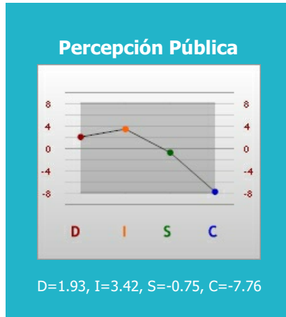
Gráfico de Estilo de Temperamento (DISC)